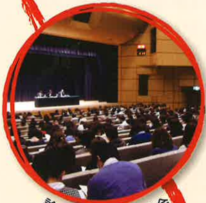
診療報酬改定説明会