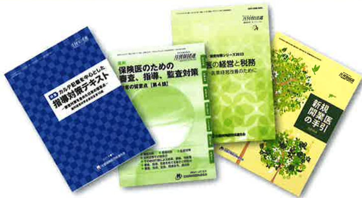
▲指導対策や経営に役立つ書籍も多数出版

そのほか多数の書籍を取り揃えています。詳細については茨城県保険医協会または全国保険医団体連合会ホームページよりご確認くださいだけです。