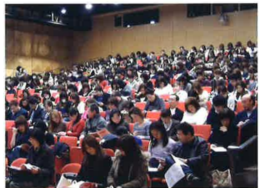
▲改定内容をいち早くお届けする新点数説明会

また、2年ごとにおこなわれる診療報酬改定のときには、複雑な告示・通知を独自に編集してわかりやすくまとめたテキストを作成し、会員医療機関に無料で配布しています。このテキストを用いた「新点数説明会」も県内各地で開催します。