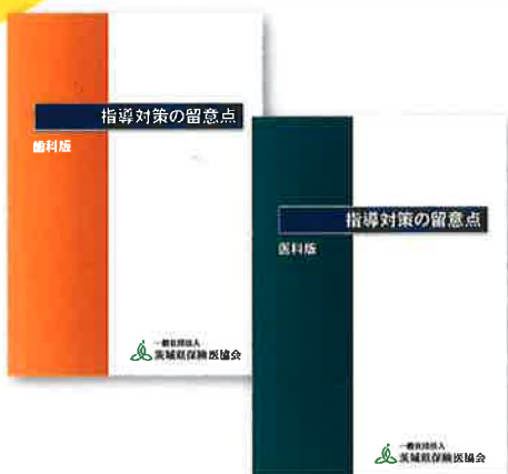
▲指導内容などの留意点をまとめた独自のテキスト

そのほか、個別指導の日程や、指導時の指摘事項など厚生局への開示請求を行い、それらの情報を新聞などを通じていち早く会員へ提供しています。