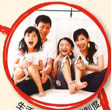
生活を支える共済制度