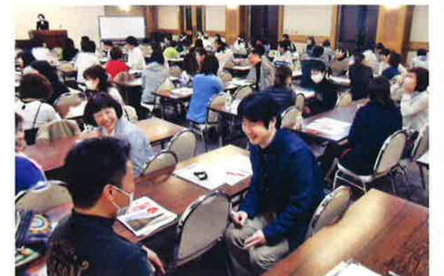
▲患者と医療者になりきって“挨拶”“態度”“表情”から好ましい表現法を学ぶ接遇セミナー

また、指導や立入検査に備えるための個別指導対策学習会、医療安全対策学習会のほか、円滑な医院運営をサポートするための経営セミナー、スタッフ向け接遇セミナーなど、多岐にわたった内容で年間合計60回以上の研修会を県内各地で開催しています。