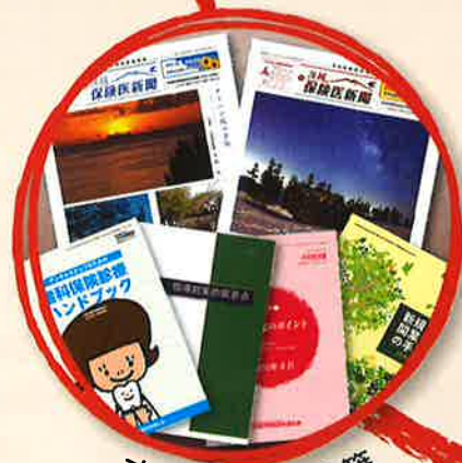
オリジナルの書籍