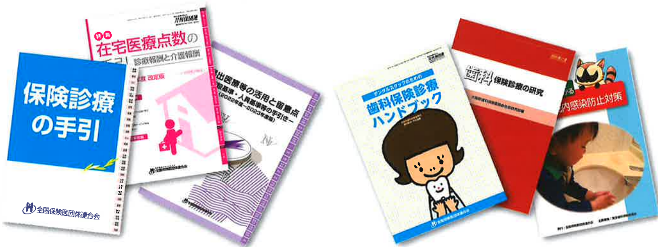
▲日頃の診療での疑問をズバリ解決